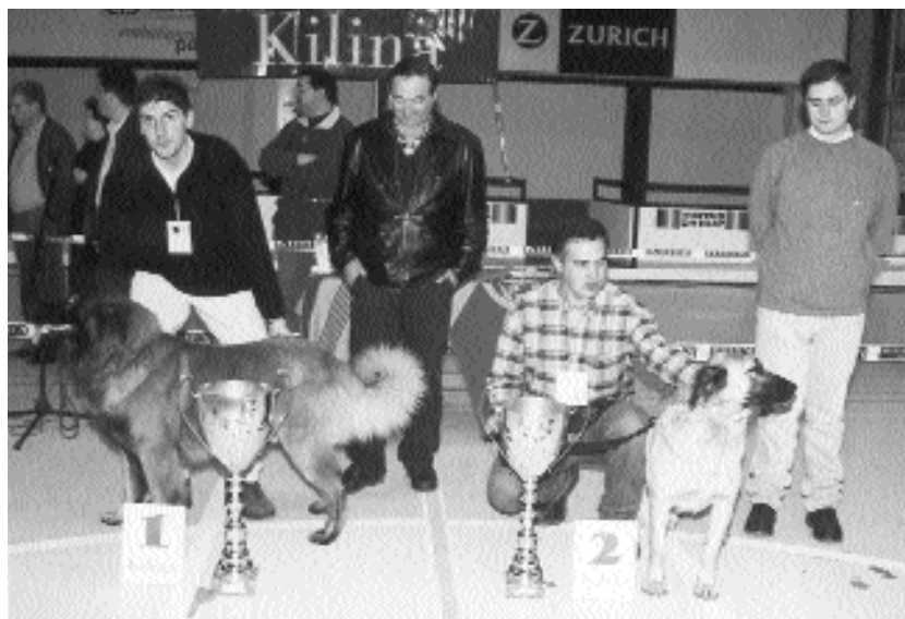
Melhores exemplares do XII Concurso Pedagógico

Este Concurso acabou por ser mais uma Festa do Cão.