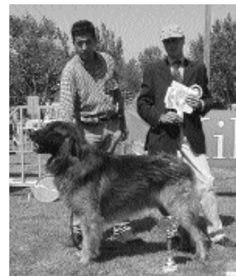
Melhor Exemplar de Pêlo Comprido