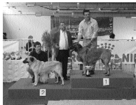
CAC-QC e RCAC-QC – Fêmeas de pêlo curto

Melhor Par: Zimbro do Cântaro Magro e Estrela do Cabeço do Seixo – PR.: Isabel Ladeira Gil.