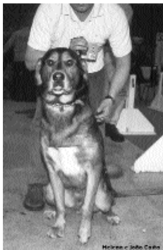
«um cão completamente atípico ao estalão do Cão da Serra da Estrela...»

Saberia a juíza que raça estava a julgar?! Parece que não, ou então desconhecia por completo o estalão do nosso querido Serra .