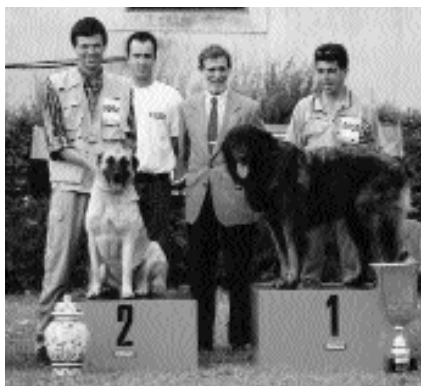
BIS e RBIS da XI Monográfica (2001)