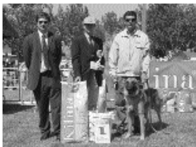
Melhor Exemplar de Pêlo Curto